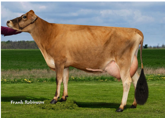
AHLEM LISTOWEL DREAM 53757-PP DAM